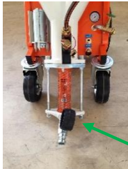
Mørtel slange trykk måler

Sjekk trykket i mørtel slange. Trykket skal være null. Dersom trykket ikke er null, kjør maskinen bakover noen få sekunder til trykket er null. Når trykket er null koble fra mørtel slangen.