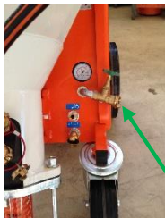
RITMO XL vannuttak