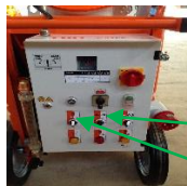
Pump motor bytte / Hastighet bryteren

Juster hastighetsvelgeren på ønsket hastighet. Tørr blanding MÅ være over "5" speed ellers vil vannet slå seg av. Normalt en god start hastighet er "8 - 9". Hvis du bruker en ferdigblandet materiale deretter under "5" speed er ok. Slå på pumpemotoren bryteren til høyre. Sjekk mørtel blanding i bøtta. Juster vannmengde SAKTE for og få ønsket konsistens. Når konsistensen er riktig sla av pumpe motor. Blandingen er klar. Husk det er en god idé å starte en litt for våt deretter justere vannmengden ned etter at du starter sprøyting. Hvis du justerer hastigheten senere på dagen vil du trenger å justere vannmengden så godt eller blandingen vil endre konsistens.