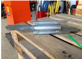
Blanding aksel rengjøringsverktøyet

Åpen toppen av blande bin igjen. Fjern blande blad og erstatte med rengjøring verktøyet. Lukk topp, slå på Rød startknappen, Trykk GRØNN -knappen, slå pumpemotoren på og kjør maskinen noen få sekunder for å rengjøre innsiden av røret. Pass på at vannet er på. Åpne toppen av lokket, og sjekk for å se om ren. Hvis ikke gjenta prosessen på nytt. Hvis du åpner blande bin må du bli Rød start knappen igjen og presse GRØNN -knappen for å aktivere kontrollene.