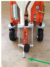
Vann bør slutte å komme ut her

Slå av vannet på RITMO XL. Slå på hoved RØD strømbryteren, trykk GRØNN -knappen. Slå på pumpemotoren og kjør maskinen i noen sekunder drener alt vannet ut av maskinen. Når vannet slutter å komme ut Rotor / Stator deretter slås av. IKKE GÅ FOR LENGE UTEN VANN DET VIL BRENNE OPP ROTOR / STATOR!