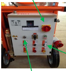
Vann / på-bryter

Slå på RED hovedstrømbryteren på Ritmo XL. Trykk GRØNN -knappen. Må gjøre dette hver gang du slår den av.