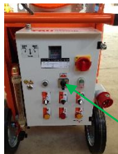
Kompressor på bryteren

Slå på kompressoren bryteren på Ritmo XL