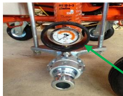
Mørtel slange Trykkmåler

Sjekk trykket i mørtel slange. Trykket skal være null. Dersom trykket ikke er null kjør deretter maskinen bakover noen få sekunder til trykket er null. Når trykket er null fra koble mørtel slangen.