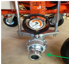
Rotor / Stator ventil

Sjekk mørtel trakt å sørg for at den fortsatt er tørr. Legg to poser med tørr mix. Sett en bøtte foran ROTOR / STATOR å fange opp blandet mørtel.