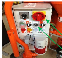
Main power switch

Slå på RØD hovedstrømbryteren på G4. Trykk GRØNNE Start-knappen for å aktivere kontrollene. Hvis du bruker 400V så sjekk for å være sikker på elektrisitet går i riktig retning, hvis GULE lyset er på så er den i revers. Bare slå hovedbryteren i motsatt retning. Hvis du bruker 230V spiller det ingen rolle hvilken retning det går.