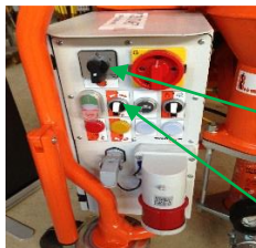
Pumpe motorbryteren / transportbånd hjul bryter

Slå på transportbånd hjulet bryter. Slå på pumpemotoren bryteren til høyre. Sjekk mørtel blanding i bøtta. Juster vannmengde forsiktig for å få ønsket konsistens. Når konsistensen er riktig Slå av pumpemotor og transportbånd hjulet. Blandingen er klar.