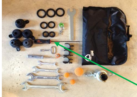
Meget grov børste