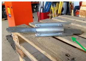
Blanding aksel rengjøringsverktøyet

Åpen toppen av blanderøret igjen. Fjern blande blad og erstatte med rengjøring verktøyet. Lukk topp, trykk Grønne Start-knappen og kjør maskinen et par sekunder for å rengjøre innsiden av røret. Pass på at vannet er på. Åpne toppen av røret og sjekk for å se om ren. Hvis ikke gjenta prosessen på nytt. Hvis du åpner miksing tube må du trykke Grønne Start-knappen igjen for å aktivere kontrollene.